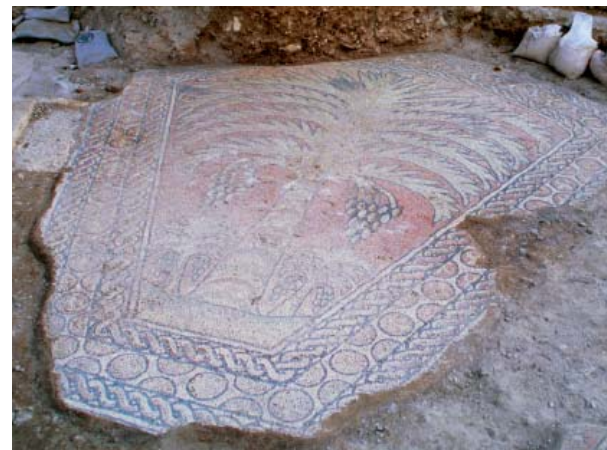
Palmenmosaik am Ort der Kathisma-Kirche bei Betlehem. Die im 8. Jh. von Muslimen in die Kirche eingebrachte Abbildung illustriert eine Legende in Sure 19: Maria bekommt am Stamm einer Palme Wehen und gebiert Jesus. Weil Christen und Muslime hier Maria verehrten, nutzten sie das Gebäude gemeinsam.

Sozomenos, Kirchengeschichte, 2,4; Übersetzung von G. C. Hansen (Fontes Christiani Bd. 73/1, Freiburg 2004, 213–215).